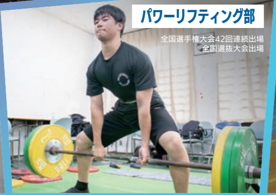
パワーリフティング部