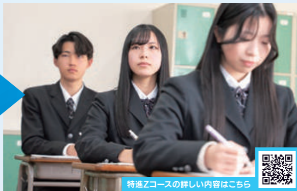
特進Zコースの詳細内容はこちら

国公立大学・難関私立大学への進学希望者を対象とし、学習に集中できる環境が整っています。一人ひとりの理解度を把握したきめ細やかな指導と、多様な講座・演習・模試を行う受験対策が特徴です。