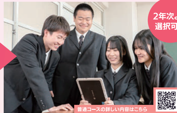
普通コースの詳細内容はこちら

自分に向いている仕事を見極め、理想の就職を目指すコースです。大学受験科目の選択はなく、理科や社会も幅広く学べるのが特徴で、社会に必要な教養やマナーが身につきます。