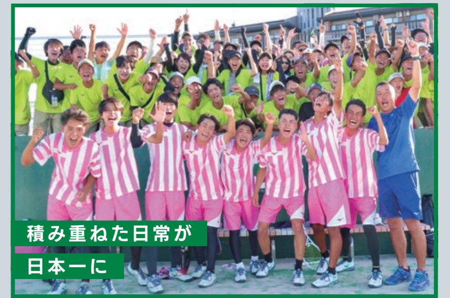
積み重ねた日常が 日本一に

岡崎城西の男子ソフトテニス部は、県内でも屈指の強豪として知られています。愛知県は競技のレベルが高く、参加数も多くて、そこを勝ち抜くだけでも大変なことです。そんな中、2025年は厳しい県予選を勝ち抜き、インターハイで初優勝することができました。過去にインターハイ決勝まで進んだことはありましたが、何度も高い壁に跳ね返されてきました。それを乗り越えて日本一という快挙を成し遂げたのです。顧問の牧先生は「日頃から部員に細かいところが勝負に出ると伝えていきます」と話します。これは部活の練習に限らず、授業のこと、挨拶のこと、言葉づかい、立ち振る舞いなど、生活に関わることすべてです。こうした