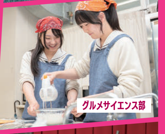
グルメサイエンス部

CUロボコン出場、C++でのプログラミング 東海地区中学・高校デイベート大会出場