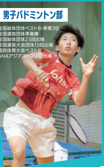
男子バドミントン部

全国総体団体ベスト8・単第3位 全国選抜団体準優勝 全国総体団体23回出場 全国選抜大会団体15回出場 国民体育大会ベスト8 ANAアジアユースU17出場