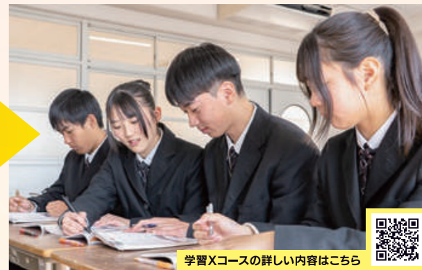
学習Xコースの詳細内容はこちら

私立大学や短大、専門学校、就職を目指す、最もクラス数が多いコースです。運動部員が多く、家庭学習時間が短くなりがちなので、重要ポイントを押さえた授業と個別対応で完全にフォローします。