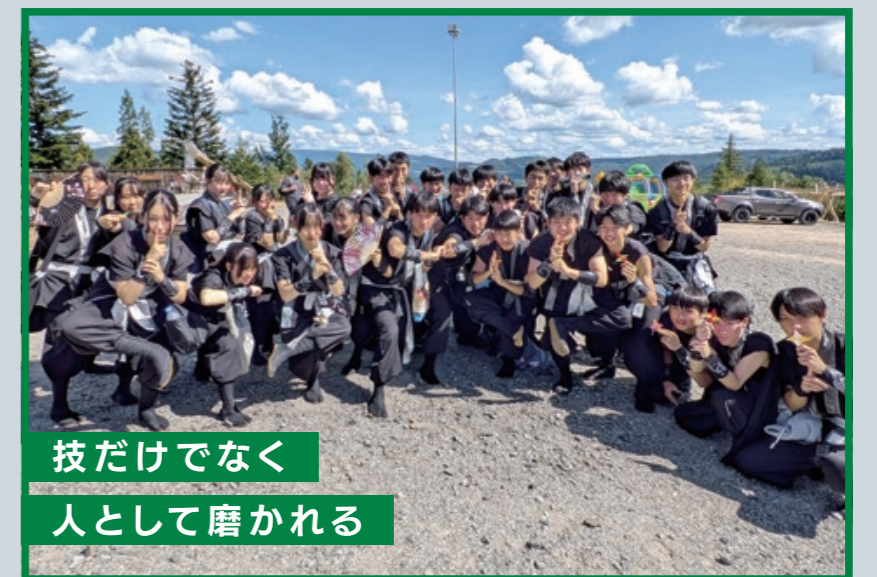
技だけでなく 人として磨かれる

生徒たちの視野拡大や文化交流を目的に、和太鼓部は海外遠征を行っています。これまでにギリシャや台湾、フランスなどに訪れていて、2025年には8回目となる海外遠征を行い、7月24日から8月7日までポーランドに行ってきました。これは国際民間文化芸術交流協会(IOV)が企画する国際交流行事です。今回は15カ国程度の国からパフォーマーたちが集まって、その国々の伝統的な音楽や踊りを披露しました。和太鼓部のチーム名は「彩輝(サイキ)」で、忍者のような衣装をまとい演奏を行いました。演奏だけでなく、他国のチームと挨拶したり、プレゼント交換をしたり、交流を深める姿が印象的でした。