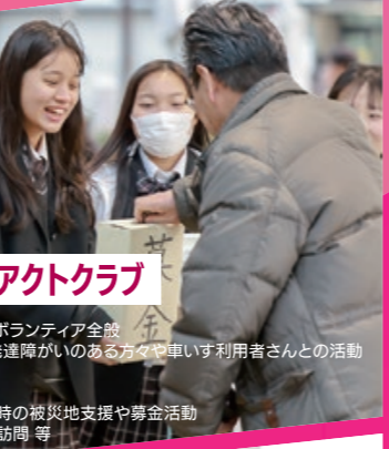
インターアクトクラブ

定期演奏会(甲山会館) セントレア空港 コーラスフェスティバル参加 地域福祉センター慰問 地域イベントにて演奏