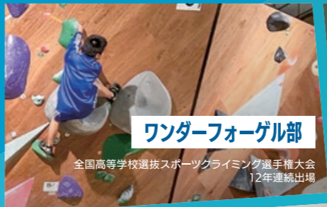
ワンダーフォーゲル部