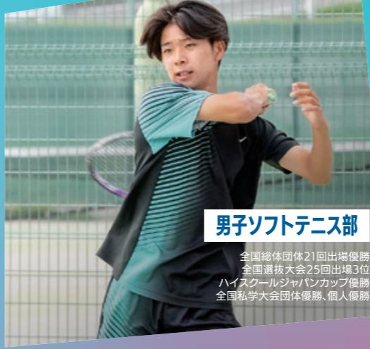
男子ソフトテニス部

全国高等学校ゴルフ選手権 中部地区予選(団体・個人の部)出場 愛知県ジュニア/中部ジュニア 中部女子学生ゴルフ選手権出場 全国高等学校ゴルフ選手権団体の部出場 全国高等学校ゴルフ選手権春季大会中部地区予選出場 日本ジュニアゴルフ選手権出場