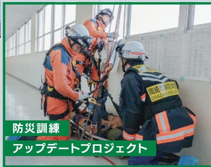
防災訓練 アップデートプロジェクト

これまでの防災訓練は、地震や水害を想定した内容でした。ところが、火災を想定した訓練となると、教員を含めて知見がないことがわかりました。「火災が発生した場合、誰が火元を確認するのか?」「何から優先すべきなのか?」など、明確にマニュアル化されていませんでした。それを見つめ直す絶好の機会になりました。岡崎城西のOB・OGには、消防士として活躍する人材が多数います。今回の防災訓練では、そうした卒業生に協力を仰ぎ、人間を背負った救助のデモなど、消防士の仕事も披露してもらいました。