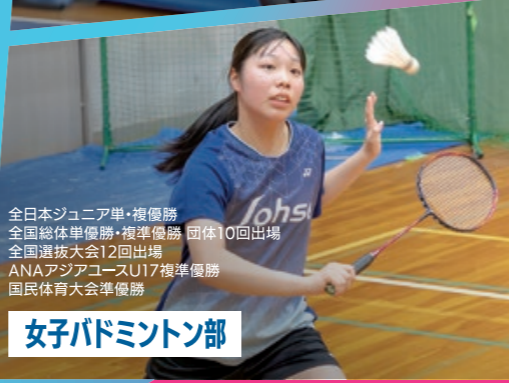
女子バドミントン部

全日本ジュニア単・複優勝 全国総体単優勝・複準優勝 団体10回出場 全国選抜大会12回出場 ANAアジアユースU17複準優勝 国民体育大会準優勝