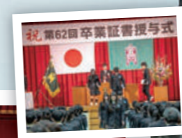
祝 第62回卒業証書授与式