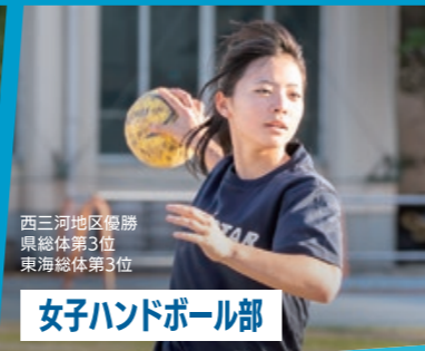
女子ハンドボール部