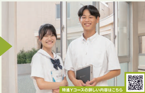
特進Yコースの詳細内容はこちら

難関私立大学を目指すコースです。部活や委員活動を続けながら、授業で基礎を固め、夏・冬休みの演習で応用力を磨く学習スタイル。部活動引退後、一気にラストスパートをかけます。