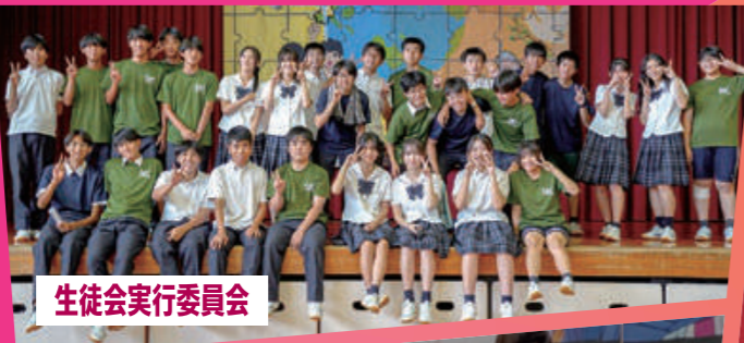
生徒会実行委員会

海外遠征8回(カンボジア、上海、台湾、フランス、イタリア、スペイン・ポルトガル、ギリシャ、ポーランド)