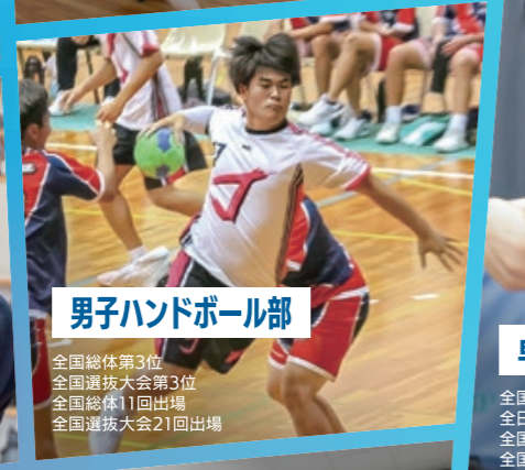
男子ハンドボール部

全国総体4回出場 全国選抜大会8回出場 国民体育大会7回出場 東海大会23回出場