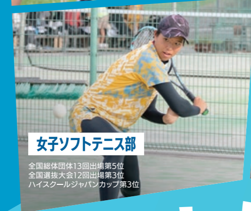
女子ソフトテニス部

全国総体団体13回出場第5位 全国選抜大会12回出場第3位 ハイスクールジャパンカップ第3位