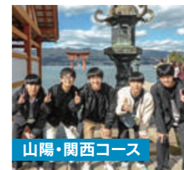
山陽・関西コース